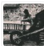
!UUS! Laiuse pärimus