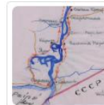
Vene folkloori veebivärv. Virumaa ja Narva-tagune