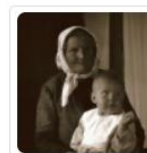
!UUS! Peetri kihelkonna veebivärv