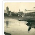
!UUS! Vaivara ja Narva veebivärv