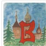
Vene folkloori veebivärv. Peipsiveer ja vanausulised