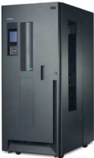
LTO-lindirobot, digitaalne arhiveerimisseade