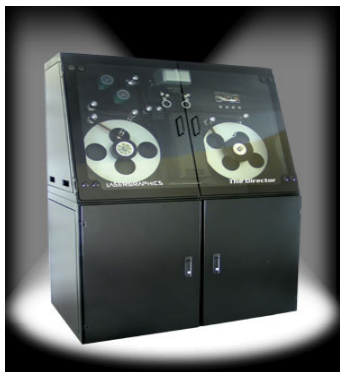
Filmiskanner – seade, mis võimaldab filmi kvaliteetselt digiteerida. Maksumus 8 kuni 50 miljonit krooni. Soetatakse ERRile riigihanke korras.