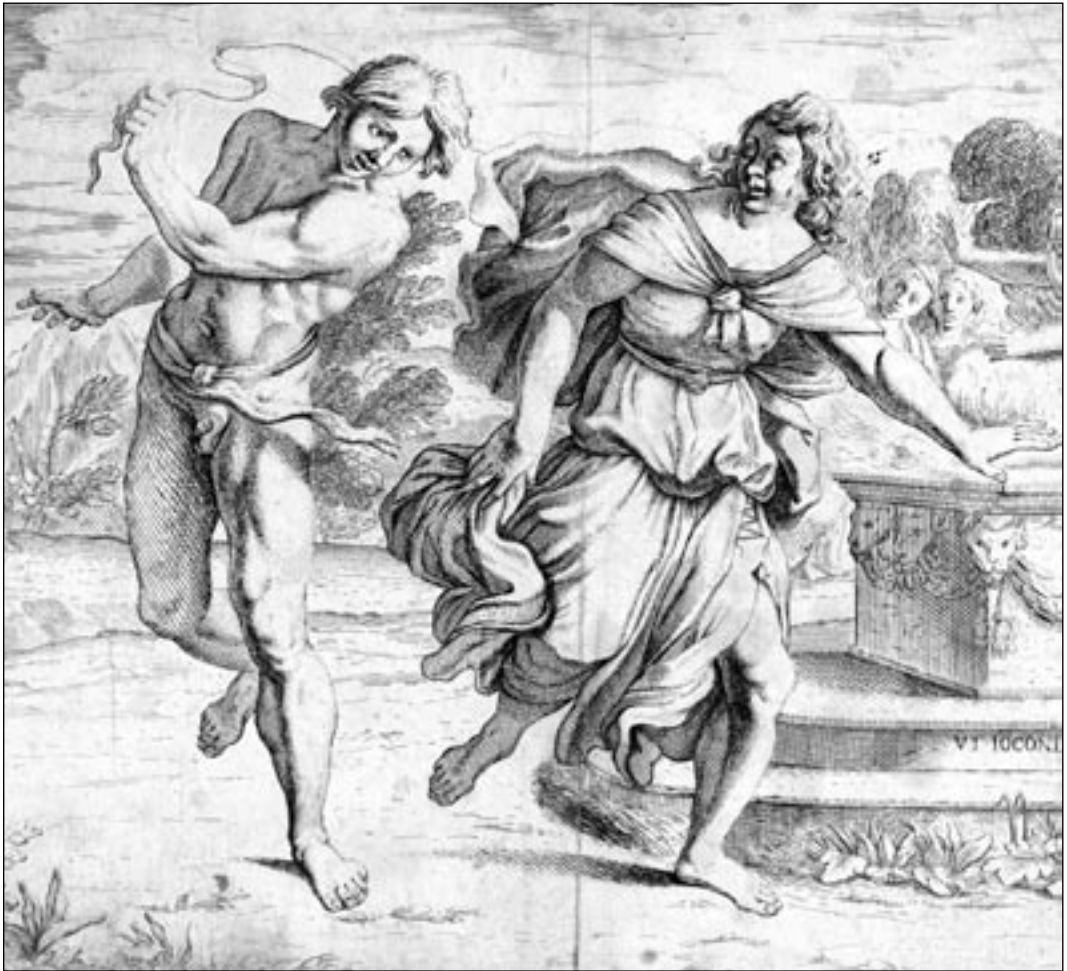
Pietro Fontana. Luperkaalide mängud. (A. Caracci järgi.) Ofort. 18. saj. lõpp. (Osa.)