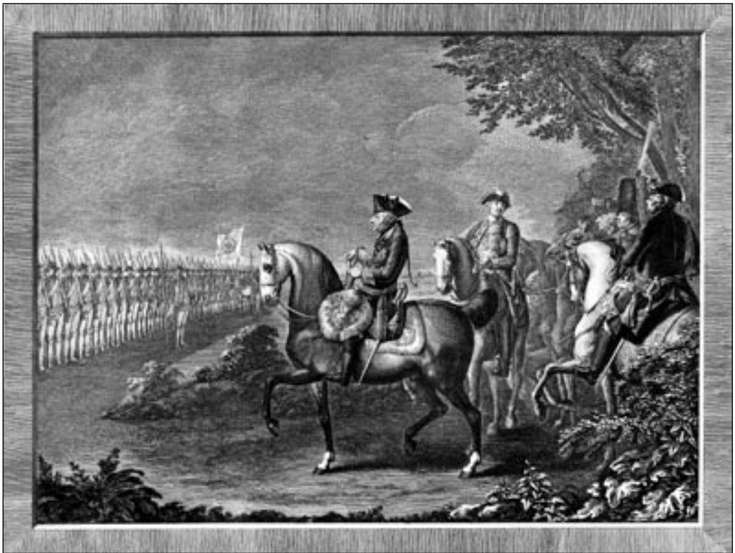
Daniel Nikolaus Chodowiecki. Preisi kuningas Friedrich II. Auvahtkonna paraad Potsdamis. Ofort. 1777.