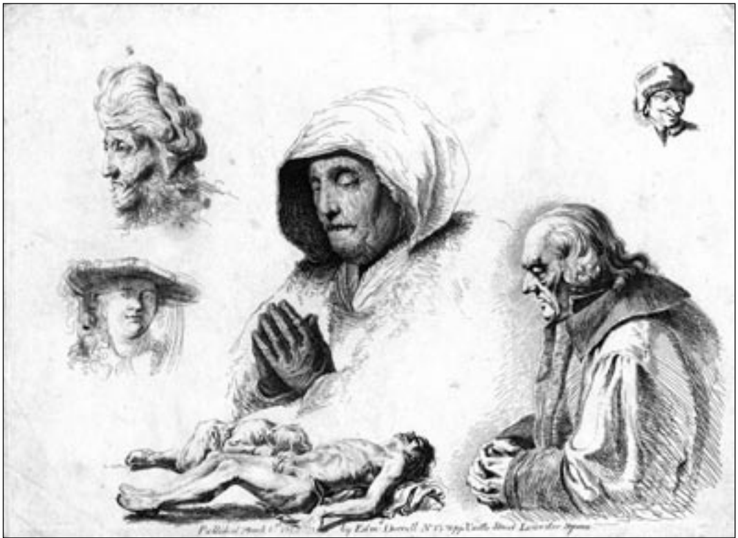
Edmund Dorrell. Etüüdid. Ofort. 18.–19. saj. vahetus.