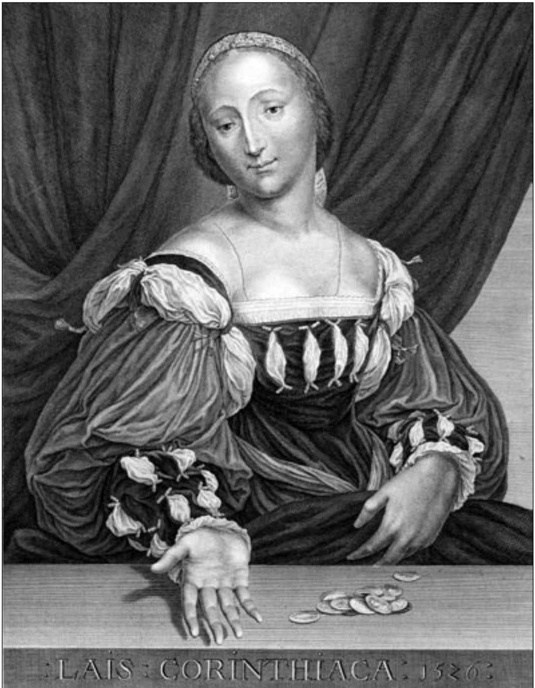
Bartholomäus Hübner. Lais Korintosest. (Hans Holbein noorema järgi.) Vasegravüür. 1794.