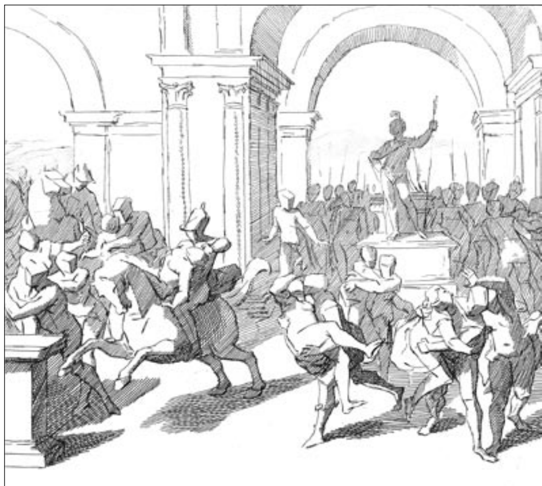
Bernard Picart. Sabiinitaride röövimine. (L. Cambiaso järgi.) Ofort. Enne 1733. aastat.