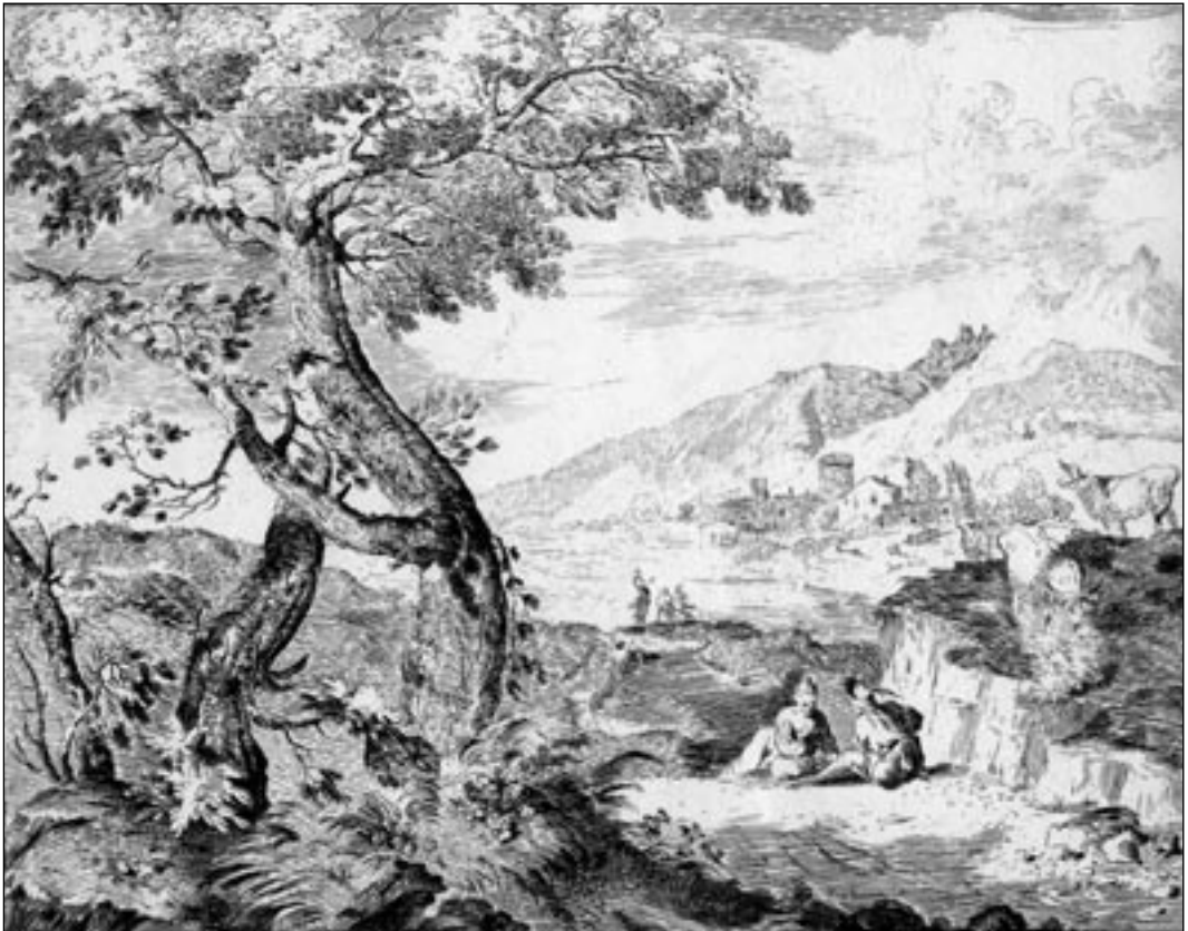
Domenico Bernardo Zilotti. Pastoraal. Ofort, vasegravüür. 1750. aastad.