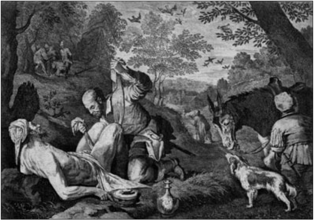
Anton Joseph von Prenner. Halastaja samaarlane. (J. Bassano järgi.) Vasegravüür. Vahemikus 1728–1735.